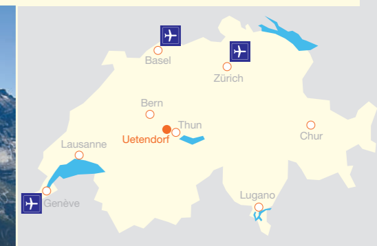
Situation NOBAG Ubicazione NOBAG