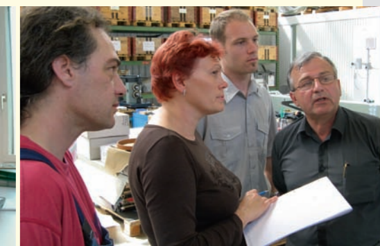
Réception des machines Collaudo macchine