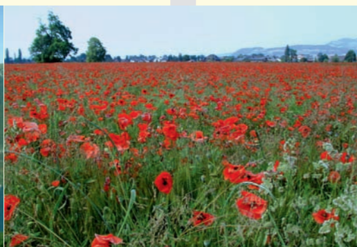
Champ de coquelicots à Gwatt Campo di papaveri a Gwatt