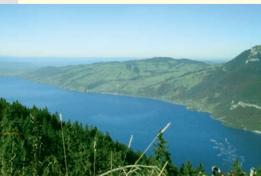
Lac de Thoune – panorama Panorama del lago di Thun