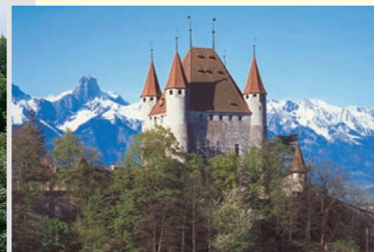
Château de Thoune Castello a Thun