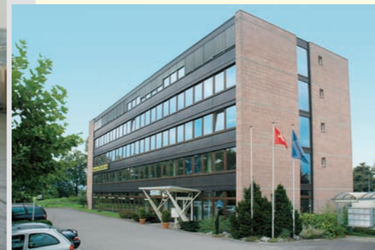
NOBAG siège principal à Uetendorf près de Thoune Sede principale NOBAG ad Uetendorf presso Thun