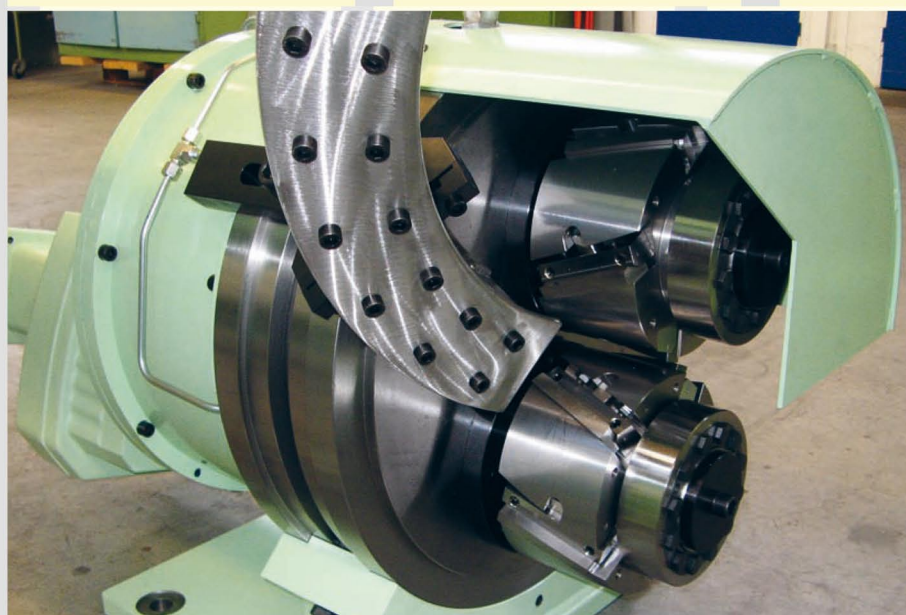
Vista generale con alimentazione nastro individuale

NOBAG, ultimo sviluppo! Pieno di forza e passo vellutato; si distingue per il particolare design. Taglia in modo morbido e senza fatica tutti i tipi di materiale entro un rapporto spessore nastro 1:10, senza dover adeguare l'aria di taglio. Interessato?