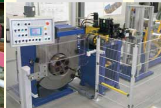
Kombinierte Schneid-Kernwickelanlage Combined slitting-core winding line