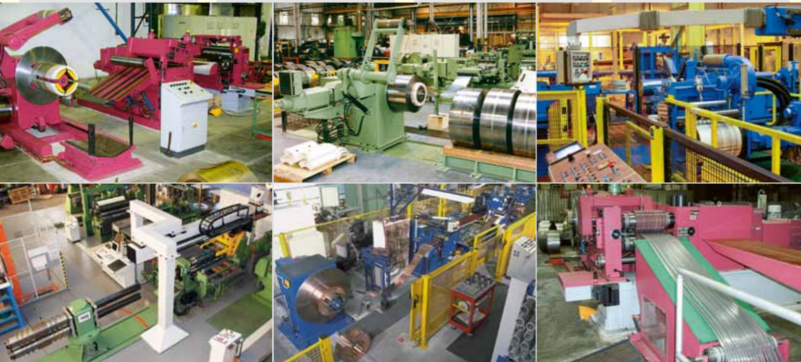
Kundenspezifische Linien in den verschiedensten Baureihen, für die verschiedensten Materialien perfekt abgestimmt auf die Ansprüche und Vorstellungen des Kunden Customized slitting lines in various ranges, for all kinds of materials – in accordance with the requirements and ideas of the customers