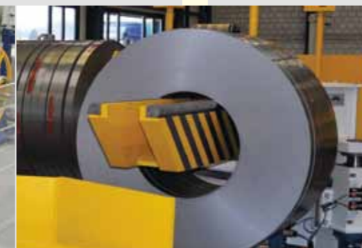
Ausgereifte Wickelsysteme für die Dünnbandindustrie für garantiert kantengerade, satt gewickelte Bunde Proven recoiling systems for the thin gauge industry to guarantee uniform, tight coils