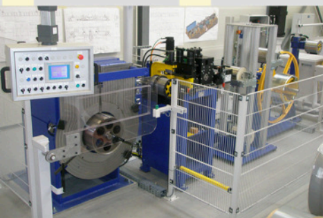
Комбинированные установки резки и намотки