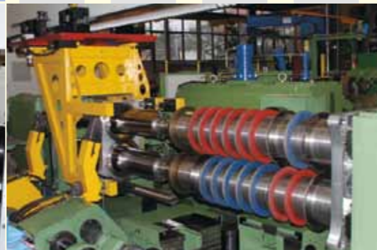
Kreismesserscheren für präzise Schnittqualität mit automatischen Werkzeugwechsel- und Spannsystemen Slitter for advanced cutting quality assisted by automatic tool loading station and clamping units