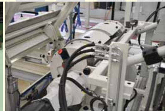
⌘ Abfallschneider ROTO ⌘ Abfallwickler ⌘ Scrap cutter ROTO ⌘ Scrap winders