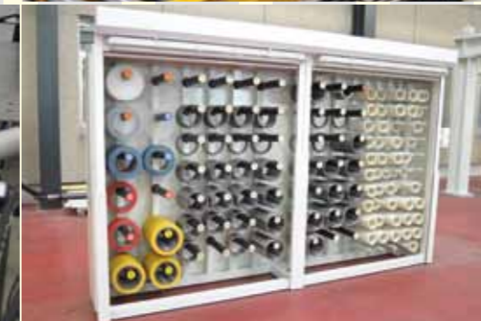
⌘ Korrekte Werkzeuglagerung ⌘ Aufwickleinheit für garantiert kantengerade, satt gewickelte Bunde ⌘ Master tool storage ⌘ Recoiling system for guaranteed uniform, tight coils